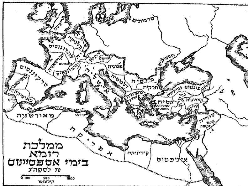
מפת ממלכת רומא בימי אספסיינוס (מתוך: תולדות היהודים בא"י בתקופת המשנה והתלמוד לגדליה אלון)

היהודים בעיר עית 7 (OEA), היא טריפולי של היום, נזכרו ע"י ההגמון אגוסטינוס בשנת 400 בערך. הוא מציין שהיו בניהם יודעי ספר. בזמנו עלו הוונדלים על אפריקה והתגברו עליה בעזרת הפרפרים, ואז תפס שבת נפוסה, שעמד בדת היהודית, את כל אזור הים של טריפולי. במאה השביעית נלחמו היהודים עם שאר העמים במוסלמים כובשי הארץ. היהודים הם שהקימו את "ג'זור אליהוד" – ארמונות ששרידיהם קיימים עד היום. כיבוש לוב ע"י המוסלמים במחצית המאה השביעית הביא עמו יהודים מגלילות ערב וסוריה. מאז חדרה הלשון הערבית והכתב הכופי המיוחד. יהודי לוב היו בקשר הדוק עם יהודי מצרים ואיטליה. תחילת הכיבוש הערבי הייתה קשה ליהודים. כך גם בתקופת אלמוהאדים. "ברית עמר" קבעה שורת הפליות לרעה בתחום החברתי והפניסקאלי, אבל הבטיחה להם מעמד של "מיעוט מוגן". בתעודות הגניזה של מצרים נזכרים יהודי טריפולי, ברקה ולבדה. בקרבת טריפולי נמצאה בימינו מצבה של תלמיד חכם משנת ד' אלפים תשכ"ג. בראשית האלף השני לספירת הנוצרים כבר היו קיימות הקהילות הגדולות של לוב. פרופ' נחום סלושץ שביקר בלוב מצא כתובות בעברית מלפני אלף שנה בערך. באזור ההר (הגיבל) מצא כתובות משנת ד"א תתק"ט. רק במאה השש־עשרה עזבו היהודים את הר נפוסה וגרו בטרפולי ובנותיה, חוץ לשלושה כפרים – אחד בפרן ושניים בהרי גיראן – שנעזבו עם קום המדינה, ותושביהם עלו ארצה.