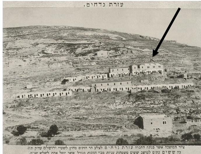
תמונות משכונת עזרת נדחים