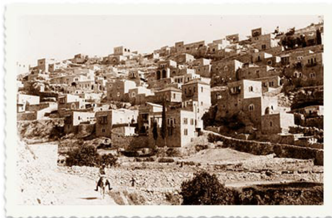
כפר השילוח שנת תרצ"ב (1932)

התימנים יזמו לרכוש שטח אדמה בגודל עשרה דונמים. הם מחלקים אותו שווה בשווה ביניהם. הואיל ואין ביכולתם לממן שכר פועלים והשגחה על הבנייה, הם מסייעים זה לזה, כל אחד במקצוע שהוא מתמחה בו. הבנייה ארכה כשתיים-עשרה שנים. הקרקע נרשמה על שם אחד התושבים כולל הוצאת אישורי בנייה. הם עבדו לפרנסתם יחד עם בניית ביתם ובתי חבריהם. 109 מאופן חלוקת העבודה בין המתישבים נמצאנו למדים שרובם המכריע של עולי תימן השתלבו במקצועות הבנייה ולא בעבודת האדמה. לא מן הנמנע שפרומקין, בראותו שאין באפשרותו לקיים את הבטחתו – חקלאות כבסיס כלכלי בתחומי כפר השילוח – בא בדברים עם נסים בכר, והללו ניתבו את המתישבים למקצועות נדרשים אלו. התרחבות השכונה הפרטית הייתה בזמן בניית בתי ההקדש שנתרמו על שם הברון הירש ועל שם הנדיב רוטשילד בשנת תרמ"ח (1888). בתים אלו היו מרווחים, עם כיווני אוויר טובים, גבוהים מעל הקרקע, בית כיסא פרטי לכל משפחה וכן בור מים. הם נמצאו תלויים פחות בשכניהם שבבתי עזרת נדחים, משום שהתחלופה בבתיים אלו הייתה בתדירות גבוהה, מן הסיבות שנמנו לעיל.