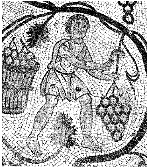
כורס ומזמרה בידו בעבודת הכרם כפי שהוא נראה ברצפת פסיפס מכנסיה בהר נבו

הנה כי כן, בהשוואה בסיסית זאת אמנם עולה בצורה בולטת מיקומו של ישעיהו בשימוש במוטיב הגפן בנבואותיו השונות.